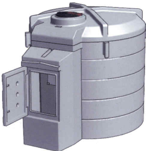
5500V GPK "FUEL KING"